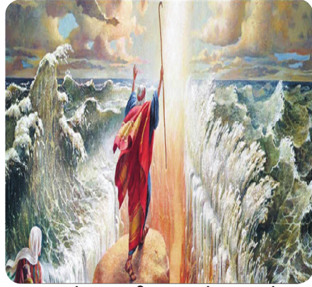
படம் 2.1 - விடுதலைப் பயணம்

திருவிவிலியத்தின் இரண்டாவது நூல் இதுவாகும். இஸ்ரவேல் வரலாற்றின் முக்கிய நிகழ்ச்சியான எகிப்திய அடிமைத் தனத்திலிருந்து மீட்டல், வாக்களிக்கப்பட்ட நாட்டை நோக்கிய 'விடுதலைப் பயணத்தை' முதன்மையாகக் கொண்டு எழுதப்பட்டுள்ளது.